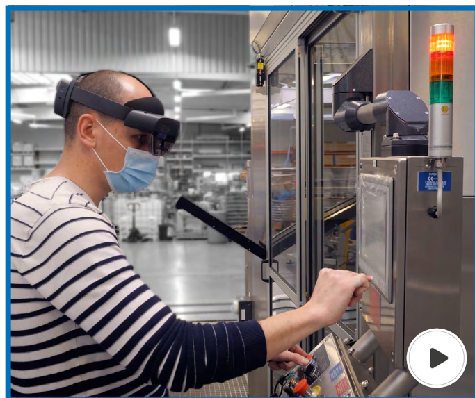
Assistance à distance possible grâce aux lunettes HoloLens 2 de Microsoft.

De plus, un extranet sécurisé sera bientôt à disposition de ses clients et de ses partenaires pour satisfaire au mieux leurs demandes et les tenir informer de l'actualité de l'entreprise.