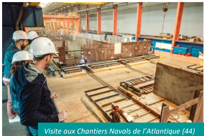
Visite aux Chantiers Navals de l'Atlantique (44)

L'association, qui fêtera son 20 ème anniversaire cette année, rassemble aujourd'hui 60 entreprises en activité dans la région Pays de la Loire et 15 partenaires associés, concernés par le tourisme de découverte économique. VNE cible la diversité des secteurs d'activités et vise l'amélioration du maillage territorial afin de répondre à l'engouement croissant de tous les publics (familles, scolaires, professionnels, habitants, touristes, particuliers ou groupes), désireux de plonger au cœur des entreprises du territoire, de découvrir la diversité des savoir-faire locaux et de rencontrer des professionnels passionnés.