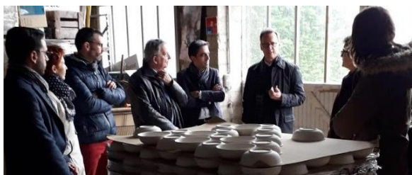
Visite de la Faïencerie de Pornic (44) pour les membres du Conseil d'Administration

Tout au long de l'année, les entreprises du réseau ont l'occasion de se retrouver pour structurer et améliorer leurs propositions de visites. VNE organise des rencontres, des ateliers partages d'expériences et des visites exclusives sur des thèmes tels que la médiatisation des visites d'entreprises, l'utilisation des réseaux sociaux pour promouvoir ses visites, la conception de parcours sensoriels, l'adaptation des visites aux scolaires... Ces réunions (parfois réalisées sous forme de visioconférences lorsque le contexte l'oblige) sont à la fois sources d'inspiration mais aussi