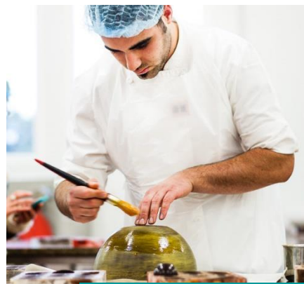
Chocolaterie Guisabel (49)

VNE aide les entreprises qui se lancent à mettre en place un circuit et une prestation de visite pour répondre au parcours et à la satisfaction de leurs publics , conformes avec la charte qualité de l'association. Tout au long de l'année, VNE organise pour ses membres, des ateliers thématiques et des formations gratuites. Ils bénéficient de conseils personnalisés et de visites diagnostic pour améliorer leur offre de visite , optimiser la gestion des réservations. VNE prépare les entreprises qui veulent aller plus loin à l'audit mystère réalisé par un cabinet indépendant, jusqu'à la labellisation Qualité Tourisme™, distinction nationale qui reconnaît l'excellence d'information, d'accueil, de promotion et d'écoute des visiteurs. A ce jour, 15 entreprises du réseau VNE ont obtenu la marque Qualité Tourisme™ pour leur activité de visite.