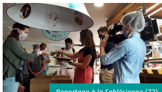
Reportage à la Sablésienne (72)

VNE relaie tout au long de l'année l'ensemble des actualités du réseau et des visites d'entreprises auprès des médias et sur les réseaux sociaux, offrant davantage de visibilité au public régional et permettant de développer la notoriété des événements de tourisme de savoir-faire régionaux.