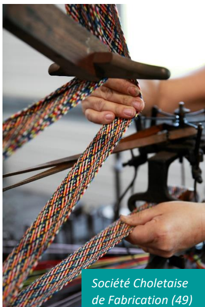
Société Choletaise de Fabrication (49)