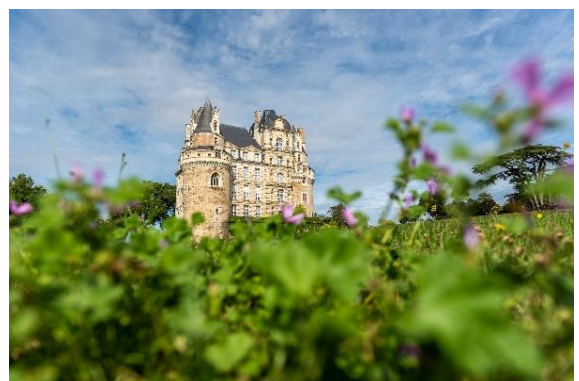
Château de Brissac - © S. Gaudard