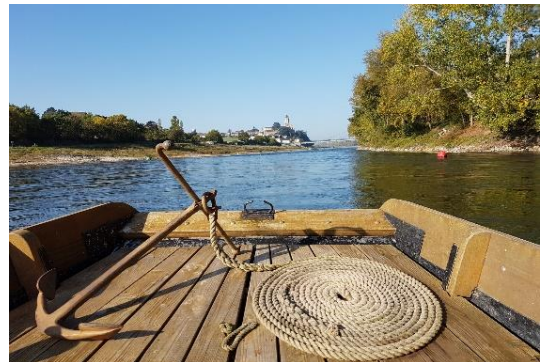
Le Vent d'Soulaire